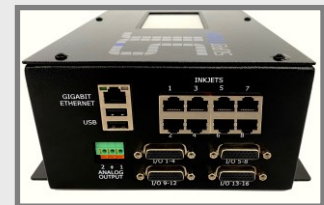
SuperTracker ST-16 für präzises Tracking